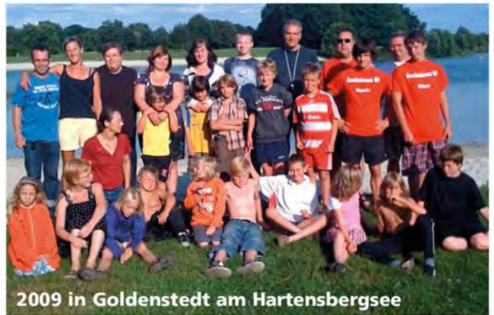
2009 in Goldenstedt am Hartensbergsee

Einer der Beweise dafür, dass DJK Rasensport, einer der beiden Stammvereine des SV Burgsteinfurt, auf die Vielfalt der gesellschaftlichen Angebote für seine Mitglieder stets großen Wert legte, war die Durchführung von Jugendzeltlagern in den Sommerferien. Das erste fand 1964 in Steinbeck statt, das letzte 2010 in Goldenstedt. Dazwischen lagen 46 solcher Angebote, mit denen der Verein seinen Breitensportcharakter dokumentierte. Zunächst waren Orte in der näheren Umgebung die Ziele, später wurden es entferntere, mit Ameland, Liedekerke und Texel auch ausländische.