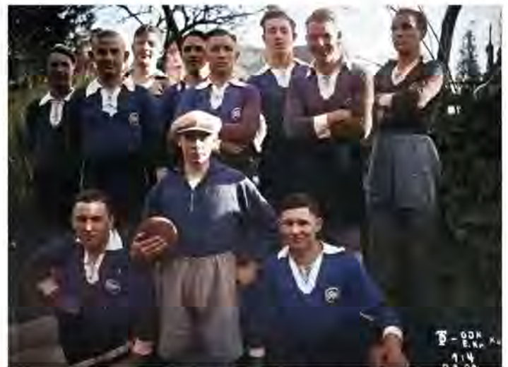
Am 7. Februar 1932 Lokal-Handball-Derby Turnerbund Burgsteinfurt gegen DJK und Eichenkreuz CVJM kombiniert 1 : 4.