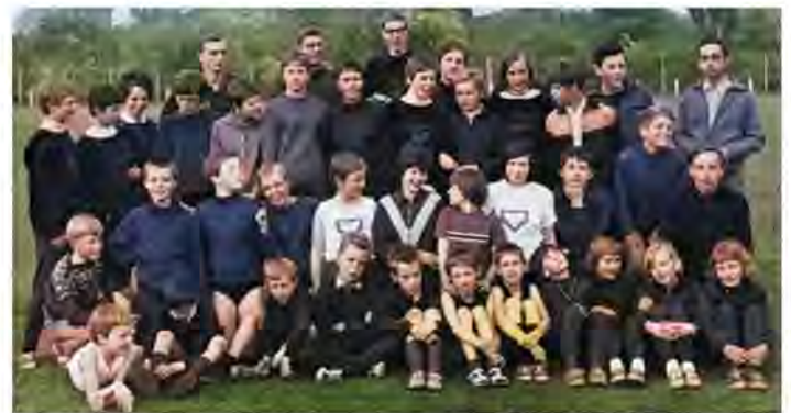
Die DJK-Leichtathletinnen und Leichtathleten in den 1960er Jahren.

Jedermann- und Seniorensport wurden schon bald nach der Wiedegründung des Vereins zu einem Anliegen des Vorstands. Zwar geht es in dieser Abteilung nicht mehr so sehr um Wettkämpfe und Siege, aber so manchen Pokal brachte die Hobby-Volleyballgruppe von Turnie-