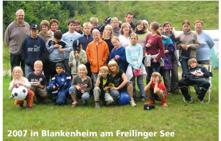
2007 in Blankenheim am Freilinger See