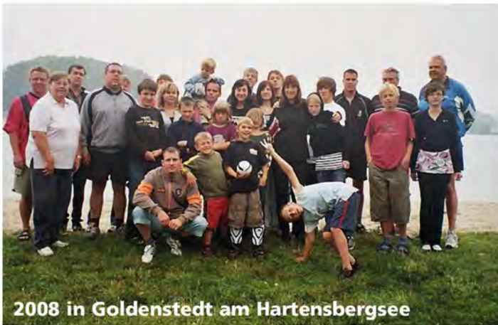
2008 in Goldenstedt am Hartensbergsee