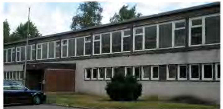
So sah sie aus, die am 26. September 1962 eingeweihte und im Juli 2010 abgerissene Baumgartenhalle.