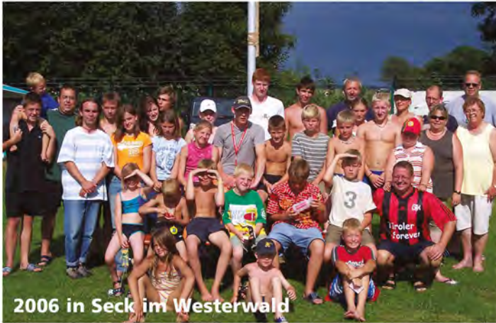
2006 in Seck im Westerwald