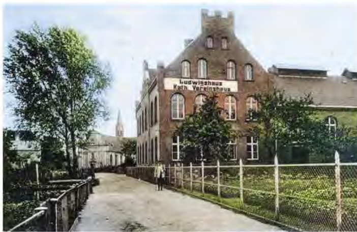
BURGSTEINFURT. Kath. Vereinshaus Wolfgang Gieseler

Eng verbunden mit DJK Rasensport ist zweifellos das Ludwigshaus. In dasselbe Jahr, in dem es eingeweiht wurde, nämlich 1903, fällt auch das Gründungsdatum des Vereins DJK Rasensport. Genau genommen, seines Vorläufers, des Aloisius-Vereins. Er hatte im Ludwigshaus seine Versammlungsstätte und seine Turnabteilung im selben Haus ihre Übungsstätte. Jahrzehntlang blieb das Haus der zentrale Treffpunkt der gesamten DJK-Familie. In der Festschrift vom 1993 heißt es dazu: „Für eine Übergangszeit waren sogar Trainingsmöglichkeiten