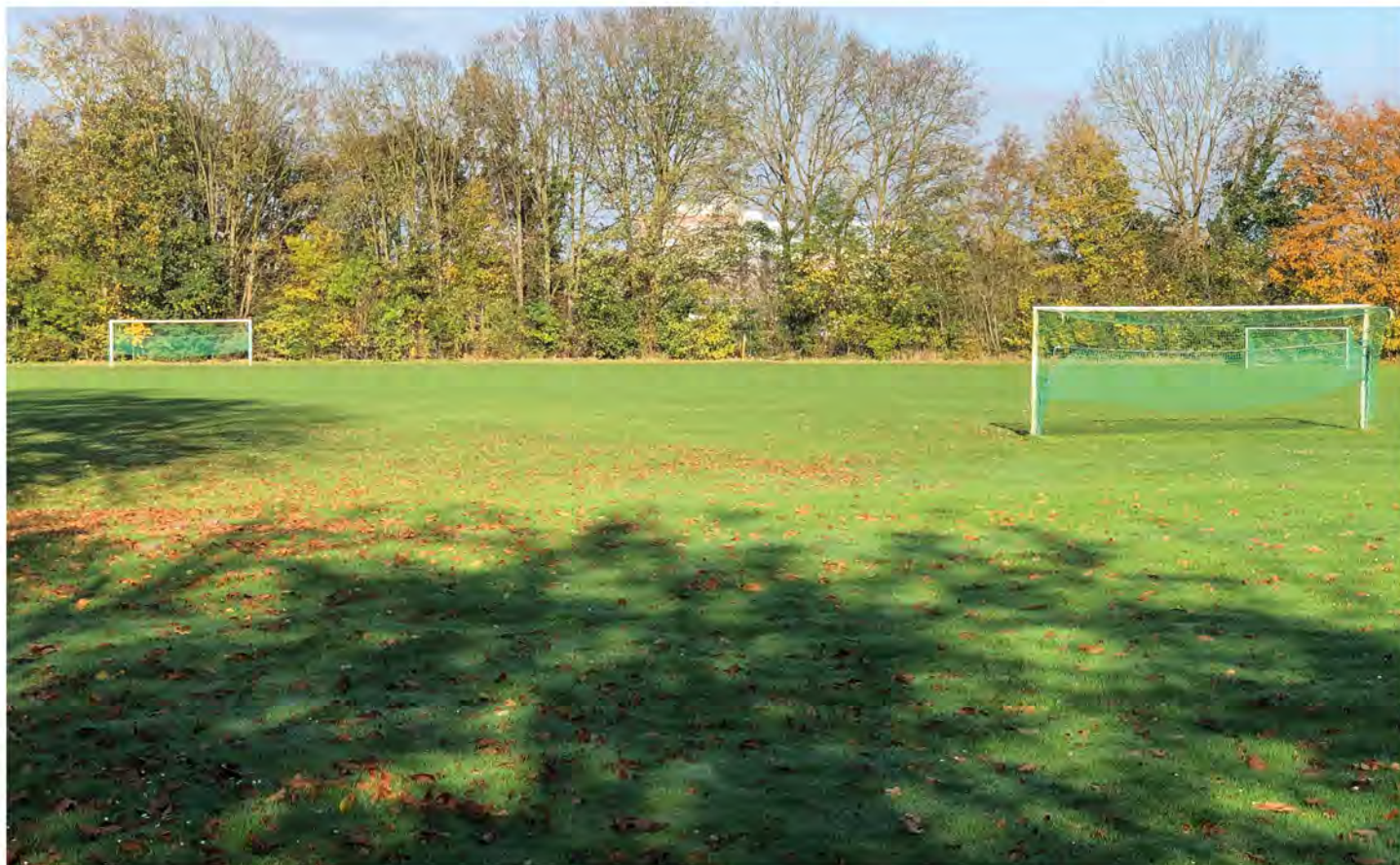
Der Bagnoplatz im Herbst 2020.

Während in mancher umliegenden Gemeinde längst vorbildliche Sportanlagen geschaffen worden waren, stand Burgsteinfurt Anfang der 1960er Jahre immer noch in dem Ruf, den schlechtesten Sportplatz zu haben. Die Bemühungen der Vereine um eine Lösung des Problems schienen lange bei Politik und Verwaltung nicht das erhoffte Echo zu finden, wenn auch die Ratsmitglieder 1960 zumindest ihren guten Willen dokumentierten, als sie nach einer Beratung dieses Problems spontan ihre Sitzungsgelder spendeten, um den Grundstock zu den finanziellen Voraussetzungen zu legen.