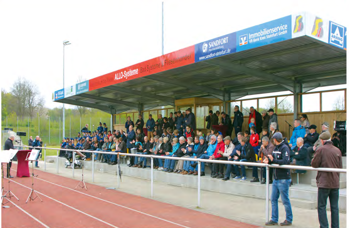
Einweihung der Tribüne im Volksbank-Stadion am 30.4.2016.