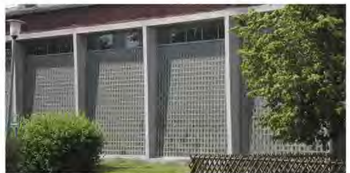
Im oberen Foto die Südseite mit dem Eingangsbereich, im unteren die Nordseite mit der Glasbausteinwand.