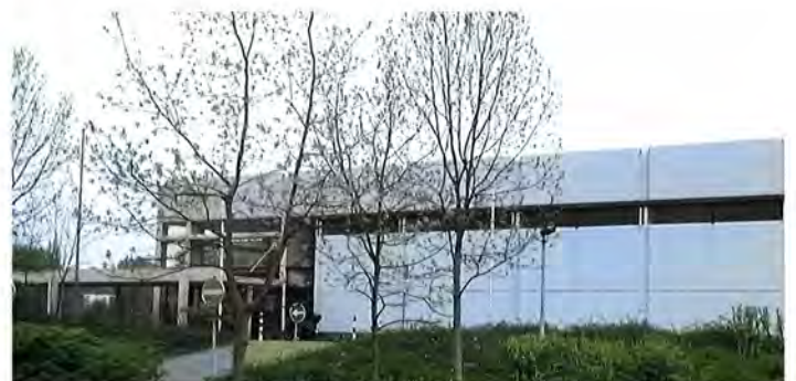
In der Dreifachturnhalle des Kreises Steinfurt an der Liedekerker Straße findet seit 1987 regelmäßig das Hallenturnier des SVB statt.