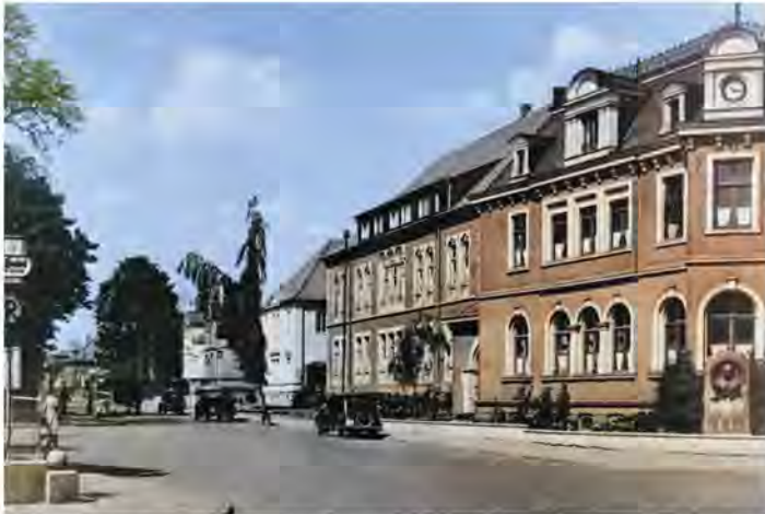
Ehemaliges Gebäude der Kreisverwaltung an der Ecke Bahnhofstraße/Ochtruper Straße. Später entstand dort die Hauptstelle der Kreissparkasse.

hatte die Kommandantur ihren Sitz. Sie wären schlechte Gesandte des Inselreiches gewesen, von dem aus so manches Spiel seinen Siegeszug um die Welt angetreten hat, wenn sie nicht schon bald nach Kriegsende Fußball-Kontakte geknüpft hätten. Und so waren dann nach 1945 die englischen Soldaten die ersten Spielpartner für die mühevoll zusammengestellte Mannschaft des Sportvereins „Union“ Burgsteinfurt, in dessen Reihen Krieg und Gefangenschaft große Lücken gerissen hatten.