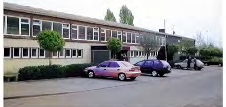
Die Baumgartenturnhalle an der Jahnstraße wurde 1962 eingeweiht und war zu der Zeit die größte Sporthalle im Münsterland.