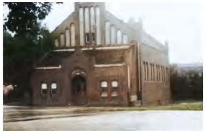
Die ehemalige Seminar-Turnhalle wurde 1977 abgerissen, nachdem für die Realschule und die Hauptschule an der Liedekerker Straße eine städt. Dreifachturnhalle errichtet worden war.

2022 fiel das SVB-Turnier coronabedingt aus. Im Januar 2023 konnte man dann die lange und schöne Tradition mit einem hervorragenden, in jeder Hinsicht erfolgreichen Turnier fortsetzen. Die sehr gute Resonanz, die es bei Spielern und Zuschauern hervorrief, darf sowohl als Beweis für die Attraktivität dieser Veranstaltungsreihe gewertet werden als auch als motivierendes Zeichen des Dankes an die vielen Helferinnen und Helfer im Organisationsteam.