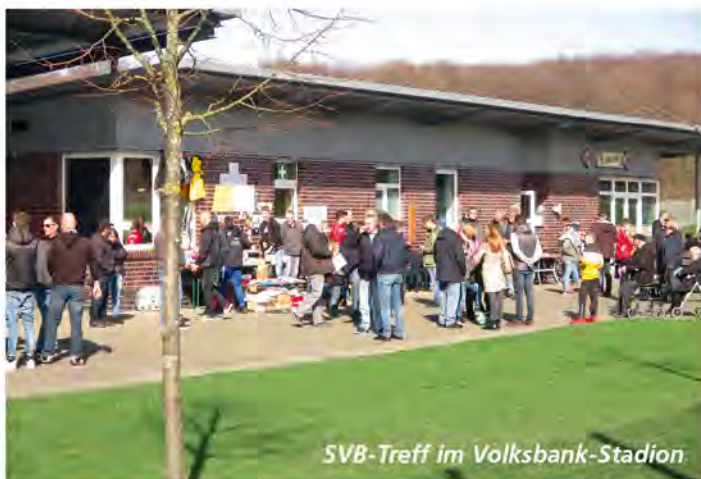
SVB-Treff im Volksbank-Stadion

Das Problem eines Vereinshauses oder einer Vereinsgaststätte löste sich auch mit der Zusammenlegung der beiden Vereine im Jahre 1998 zum SVB nicht; denn keiner der beiden brachte ein eigenes Domizil mit in die „Ehe“. Im Zusammenhang mit Überlegungen, eine dringend erforderliche Geschäftsstelle einzurichten, wurde dann die Idee verwirklicht, auf dem Gelände des Baumgarten-Stadions den jetzigen Pavillon, den „Sportler-Treff“, zu erstellen. Er hat den Vorteil, eng am sportlichen Geschehen für die Aktiven und die Zuschauer da zu sein und bietet außerdem die Möglichkeit, Versammlungen im kleineren Rahmen oder auch Vorstandssitzungen abzuhalten. Auch zahlenmäßig kleinere Gesellschaften können ihre gemütlichen Veranstaltungen hier ausrichten. Aber eine Vereinsgaststätte im traditionellen Sinn ist unser „Sportler-Treff“ nicht, zumindest noch nicht.