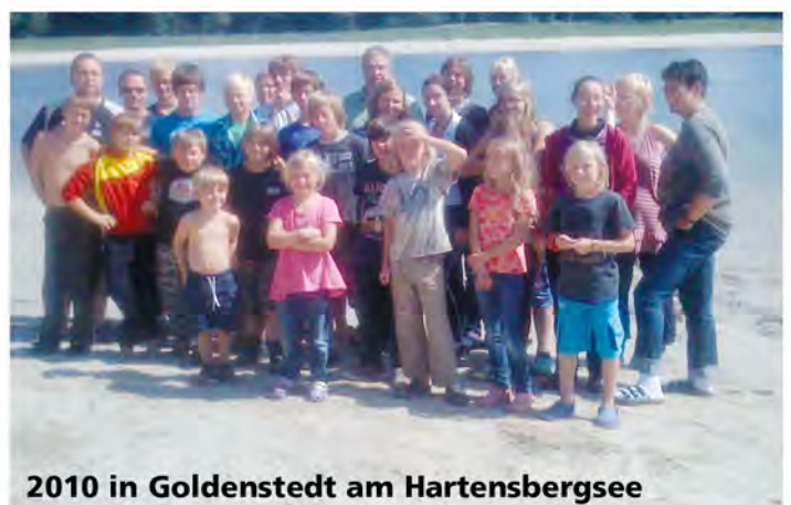
2010 in Goldenstedt am Hartensbergsee

Die Attraktivität, durch die sich das Zeltlager auszeichnete, hielt über Jahrzehnte an. Die Plätze waren begehrt und somit schnell vergriffen. Für viele der jugendlichen Teilnehmerinnen und Teilnehmer bedeutete solch ein Lageraufenthalt den Höhepunkt ihrer Sommerferien. Den engagierten Organisatorinnen und Organisatoren, die sich schon lange vorher und mit großem Einsatz und Erfolg jedes Jahr um geeignete Zeltplätze und abwechslungsreiche Programme für jeweils zwei Wochen bemüht hatten, war bei der Rückkehr ein herzliches Dankeschön der durchschnittlich 45 Teilnehmerinnen und Teilnehmer und der betreffenden Eltern sicher. Immer wieder fanden sich Mitglieder bereit, den Organisationsstab zu bilden und die Arbeit und die Zeit zu investieren, den