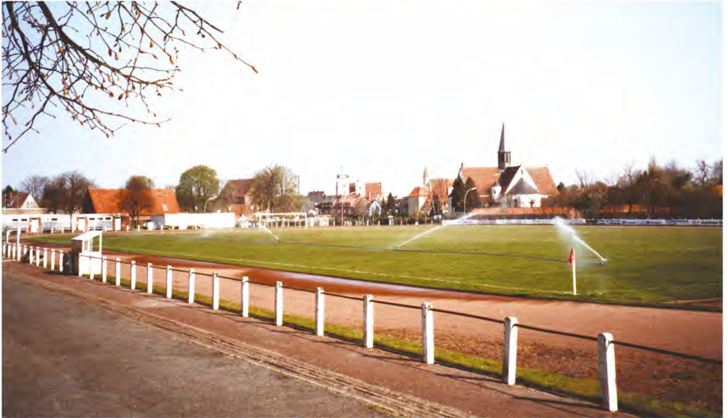
Das Baumgarten-Stadion, Burgsteinfurts Außensportanlage von 1966 bis 2006.